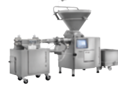
↑ PLSH 217 con corte