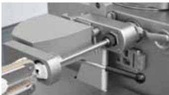
↑ Carga de tripa con mano automática y embudo de torsión

La excelente precisión del rotor de aletas de la embudidora al vacío Handtmann garantiza un porcionado al gramo y la carga constante de la PLH 216. La mano automática está equipada con un accionamiento de bajo desgaste y un freno de tripa sensible y flexible que garantiza un torsionado cuidadoso y rápido, también en tripas naturales delicadas.