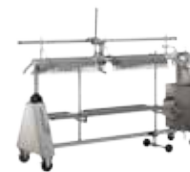
↑ Combinación con clipadora