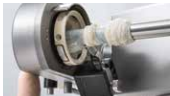
↑ Sensor de extremo de tripa

La PLH 216 coloca las salchichas torsionadas en porciones rectas o curvadas con la posición de torsionado exactamente en el gancho de la unidad de colgado. Puede seleccionarse tanto el número de ristas como el número de porciones que contendrá cada una. Una distribución estrecha de los ganchos asegura una carga óptima de los bastones y con ello el aprovechamiento completo de las instalaciones de cocción y ahumado con los consiguientes ahorros en costes y energía.