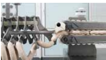
← Entrega a la unidad de colgado

La PLH 216 coloca las salchichas torsionadas en porciones rectas o curvadas con la posición de torsionado exactamente en el gancho de la unidad de colgado. Puede seleccionarse tanto el número de ristas como el número de porciones que contendrá cada una. Una distribución estrecha de los ganchos asegura una carga óptima de los bastones y con ello el aprovechamiento completo de las instalaciones de cocción y ahumado con los consiguientes ahorros en costes y energía.