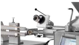
↑ Cargador de tripa